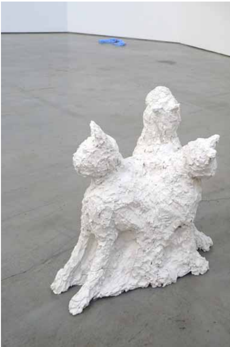
Tora Dalseng og Kristian Øverland Dahl: Katt (uten tittel) . Foto: Semb