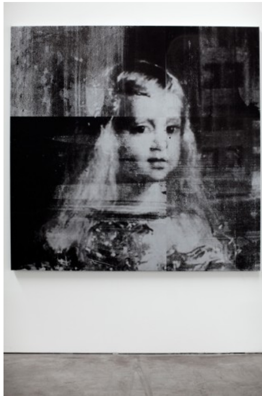
Bruce High Quality Foundation, The Princess , 2011.

Ikke noe galt i det, men det virker for meg som om komponentene aldri helt møtes i dette verket. Utsnittet av prinsessen, reproduisert og gjentatt i sorthvitt xerox-utgave, dekker hele den store salen på UKS og presenteres sammen med en video som går løs på alle mulige forbindelser og fakta i forhold til Kubricks