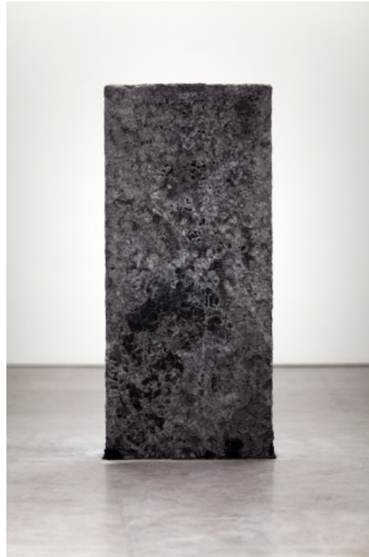
Bruce High Quality Foundation, The Monolith , 2011. Installasjonsfoto fra UKS.

BHQF har tidligere gjort intervensjoner som i mine øyne er genialt presise, sylskarpt kritiske, og av det slaget som oppleves som nødvendige. Ofte med en klokkeklar timing og tungen rett i munnen. Men det her virker ikke som det skal, altså. Det gjør ikke det. Når delene hver for seg er større enn helheten er det noe som skurrer. Mitt forslag ville være å gjøre jobben ferdig før man stiller ut, men det høres så stakk konservativt ut at jeg ikke er sikker på om det virkelig var meg som tenkte den tanken. Men hvis det ikke var