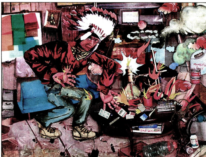
MARTHA COLBURN: «Myth Labs», 2008